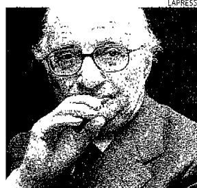
Pasquale De Vita Presidente Up

Il dicastero dello Sviluppo economico (nella foto il ministro Claudio Scajola) punta a una riforma organica entro marzo. Si valuta l'obbligo di esporre un prezzo massimo settimanale